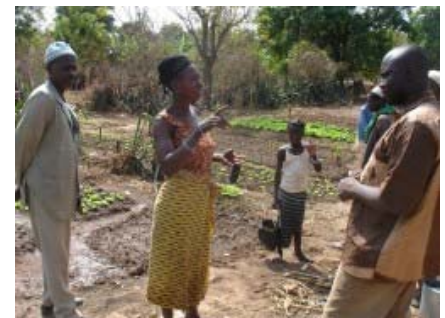
Image 10, 11 et 12 Les cultures maraîchères