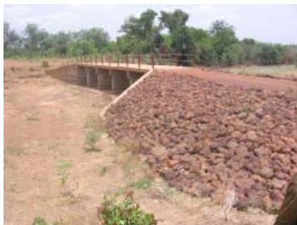
Image 3 Aménagement de bas-fonds