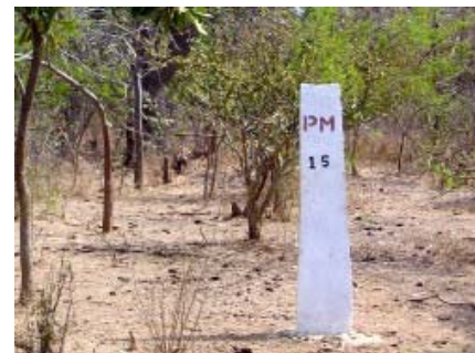
Image 4 Marquage des pistes